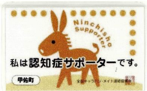
認知症サポーターカード